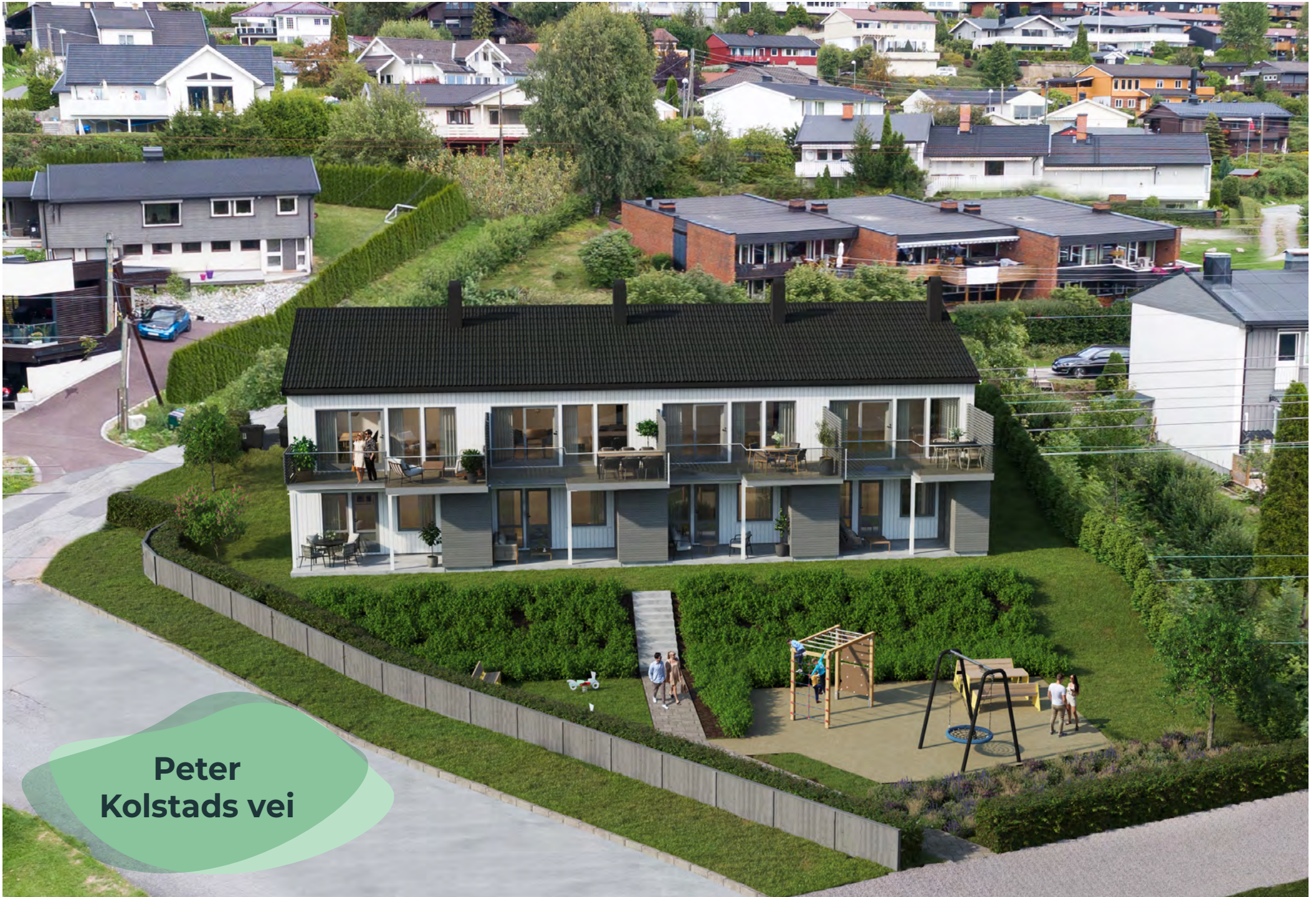
Peter Kolstads vei